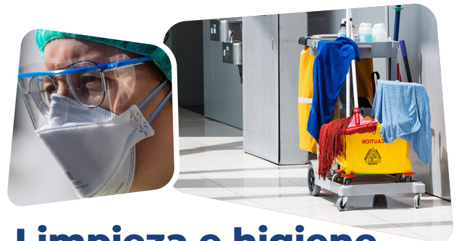
Limpieza e higiene