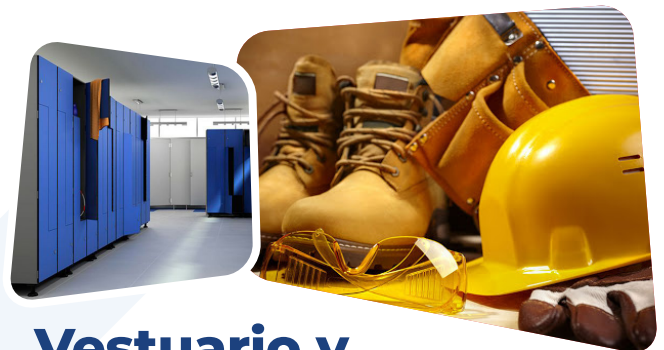
Vestuario y protección laboral