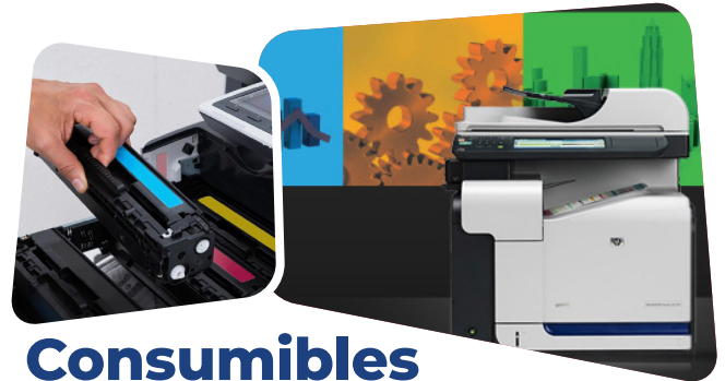
Consumibles de impresión