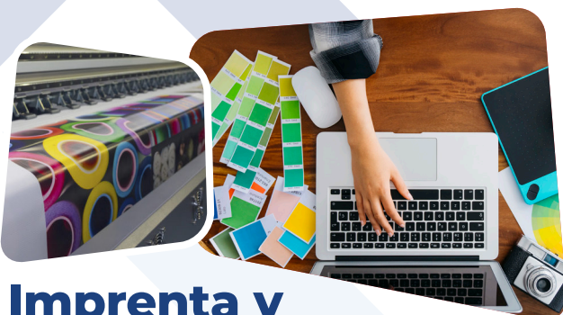
Imprenta y merchandising