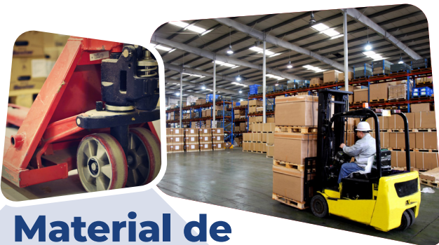
Material de almacén